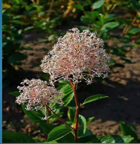
Ceanothus americana セアノサス(クロウメモドキ科)