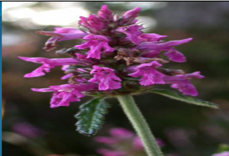
Betonica offi (カッコウチヨロギ・シソ科)